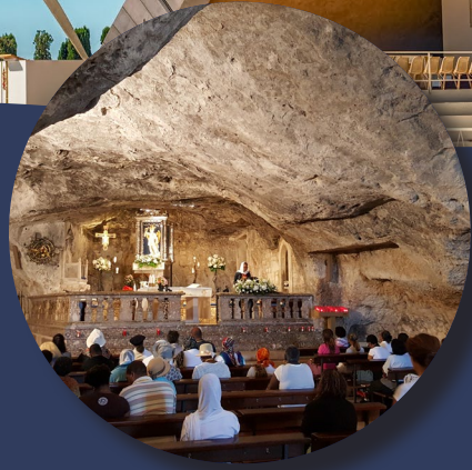
Gruta de San Miguel