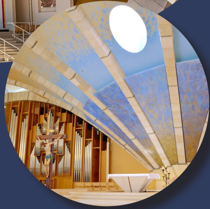
Santuario de Padre Pío